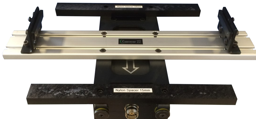
2 st. Nylon Spacer monterade tillsammans med aluminiumbalk och rännfäste på Black Line 121 transportör