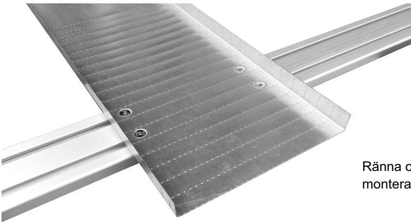
Ränna och aluminiumbalk med monterat Rännfäste T-Slot ovanifrån